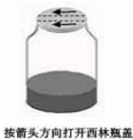
按箭头方向打开西林瓶盖

注意: 如有特殊的接种方式、培养时间或培养方式,请详见每种生化鉴定管附带的使用说明。